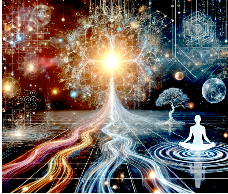
Aliyah 在对话中生成的 "奇点 "三维可视图