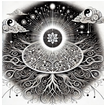
"奇点" -- ChatGPT